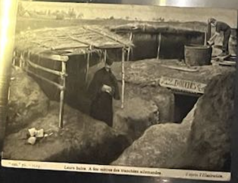
Leurs toilettes. A la fin des tranchées allemandes.