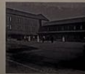
Infirmières et blessés devant un hôpital