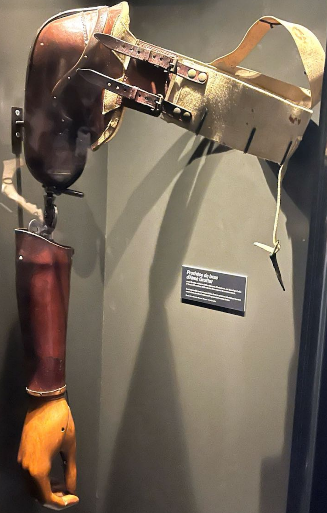
Prothèse de bras d'Hans Gruffat Fabricée en 1860 à l'arsenal d'Orléans, en bois et cuir. Elle est utilisée par le soldat Hans Gruffat pendant la guerre de 1870. Musée de la Ville de Paris - Musée de l'Armée