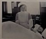
Une infirmière au chevet d'un blessé durant une nuit d'hôpital